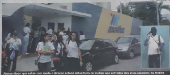
Alunos dizem que estão com medo e direção coloca detectores de metais nas entradas das duas unidades do Motiva