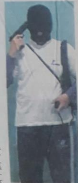
Aluno exhibe arma no Orkut

Orkut para anunciar um atentado contra o co-legio, que já está usando cinco detectores de me-tais para evitar armas. Ontem, 300 estudantes faltaram. Pág. B-1